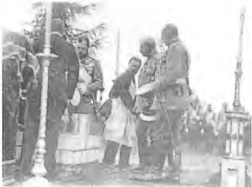
Император Николай II, Гусейн – хан Нахичиванский и барон Федерикс при закладке церкви

Западном фронте. В 1916 г. ему было присвоено звание генерала от кавалерии. Гусейн-хан Нахичеванский был награжден всеми орденами Российской империи вплоть до Белого Орла с мечами включительно, орденами Св. Георгия 4-й и 3-й ст., а также орденами ряда иностранных государств.